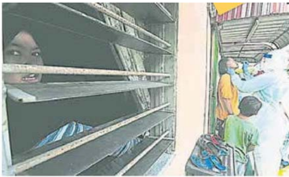
■卫生人员在巴生重灾区的甘榜兰斗班让，为当地居民进行社区免费筛检。