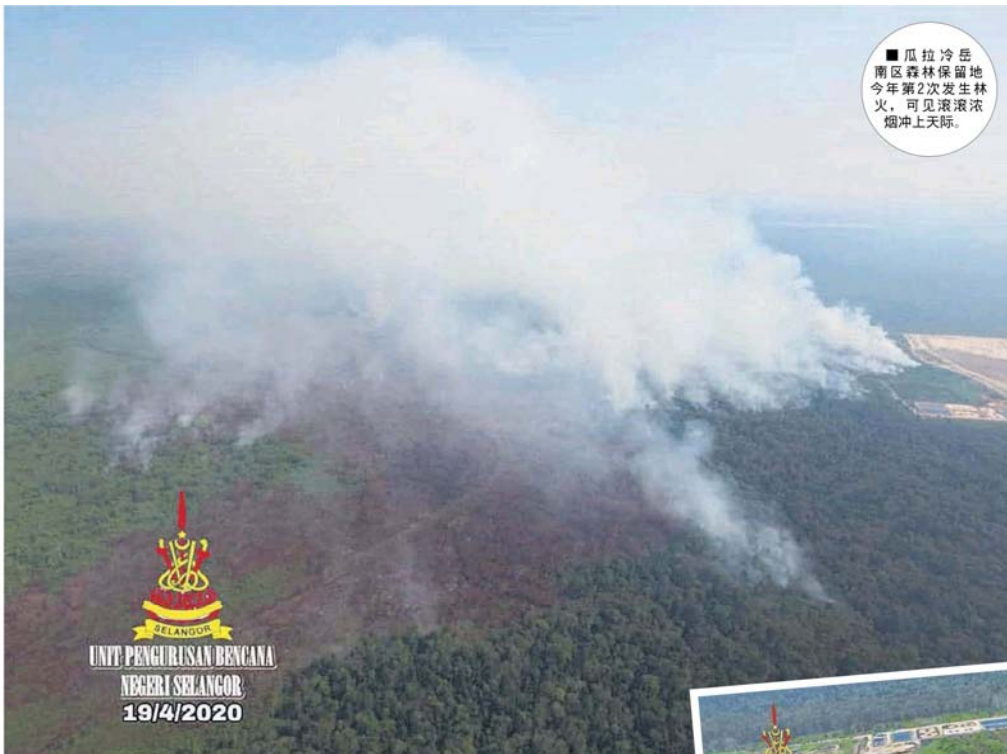
■瓜拉冷岳南区森林保留地今年第2次发生林火，可见滚滚浓烟冲上天际。

Provided for client's internal research purposes only. May not be further copied, distributed, sold or published in any form without the prior consent of the copyright owner.