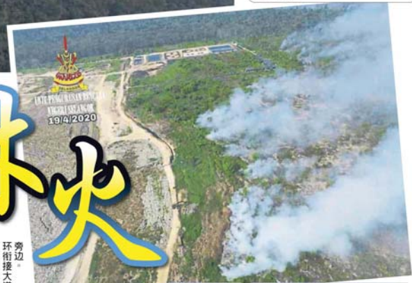
■林火涉及面积已经从15公顷蔓延至18公顷。