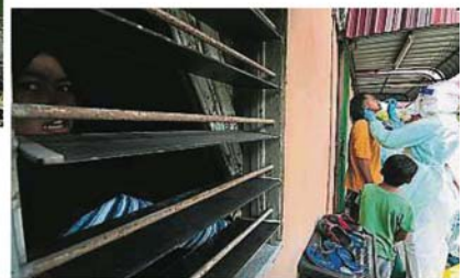
卫生人员在巴生重灾区的甘榜兰斗班让,为当地居民进行社区筛检。