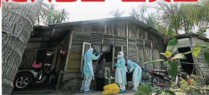
雪州政府的社区免费筛检冠病活动,已进入沙亚南和巴生区。

人性质的送餐员,都必须强制进行筛检,以确保本身不是冠病患者后,才能在斋戒月期间继续送餐。