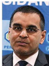
莫哈末阿兹曼：在行动管制令期间获准营业领域的员工，可到指定诊所进行新冠肺炎检测。

国际贸易及工业部长拿督斯里阿兹敏阿里日前宣布，在行动管制令期间获准营业的企业，必须让员工到全国 3000 间社险机构指定的诊所进行健康检测。#