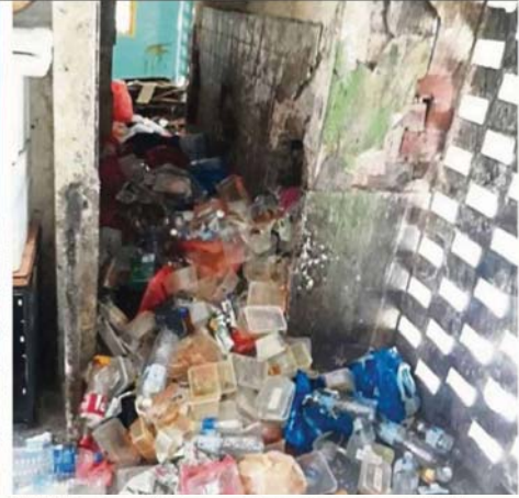
Rubbish has been left along corridors and open spaces of both buildings.