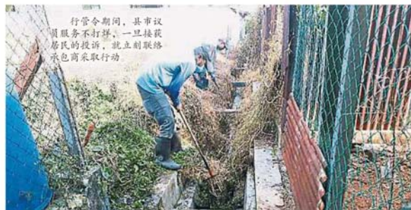
行管令期間，縣市議員服務不打烊，一旦接獲居民的投訴，就立刻聯絡承包商採取行動

(巴生19日訊)行管令期間，縣市議員服務不打烊！ 適耕莊C村民投訴住宅后方沟渠周遭和空地杂草丛生，担忧黑斑蚊滋生或沦为蛇虫鼠蚁的巢穴，严重威胁居家安全，所以向适耕莊C村管委會作出投訴。