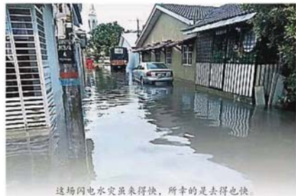
这场闪电水灾来得快，所幸的是去得也快。

(安邦19日訊)疑因不尋常測量，导致安邦哥沙花园(Taman Kosas)一带于昨天发生闪电水灾！