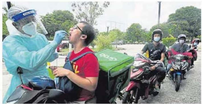
■雪州政府率先在沙亚南第7区拉惹慕达慕沙礼堂由Selcare卫生人员，对摩多送餐员进行得来速（pandu lalu）免费抽取样本进行筛检。