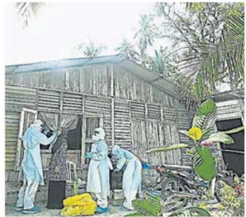
■雪州政府的社区免费筛检冠病活动，来到沙亚南和巴生区。

雪州应对冠病疫情特工队脸书专页昨日张贴的检测数据，当局迄今已筛检649个样本，其中5个呈阳性反应，即在社区内发现5宗确诊的病例。（TKM）