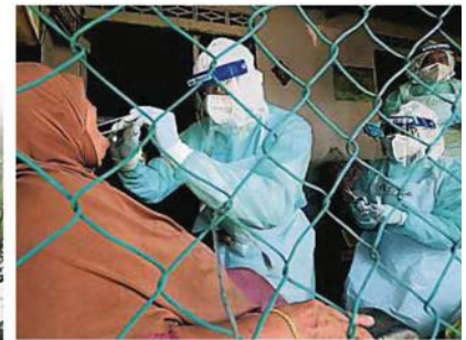
全副武装的卫生员,为一名妇女进行社区筛检。

截至昨日中午12时的数据,雪州冠病活跃红区从3个区(Mukim)跌至2个,即乌冷的67宗活跃和巴生的46宗,州内的活跃确诊为414宗、新增病例2宗。