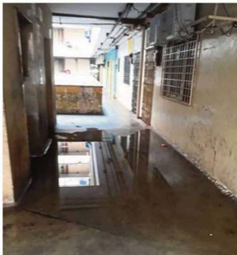
Water ponding is a major problem at Selangor Mansion.

One death was reported in Menara City One.