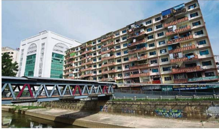
Residents of Selangor Mansion comprise mostly foreign workers.