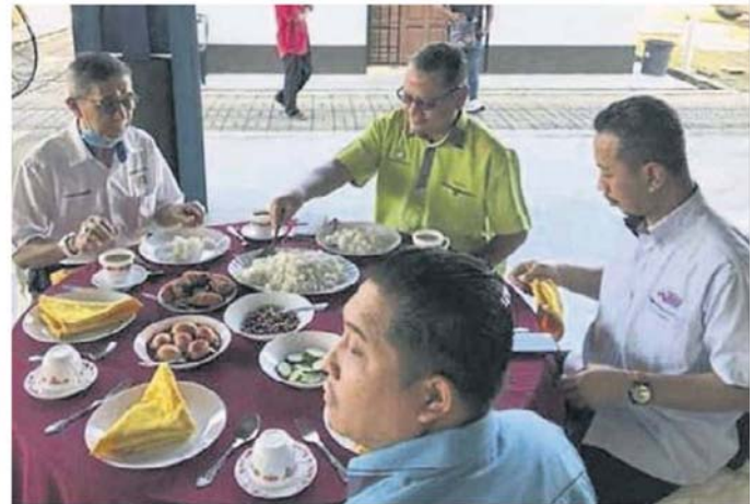
莫哈末拉昔(左)被网民发现与选民聚餐。

莫哈末拉昔也是峇株巴辖区国会议员。他在2月时与被开除党籍的公正党前署理主席拿督斯里阿兹敏阿里一起退出公正党，随后加入土团党。