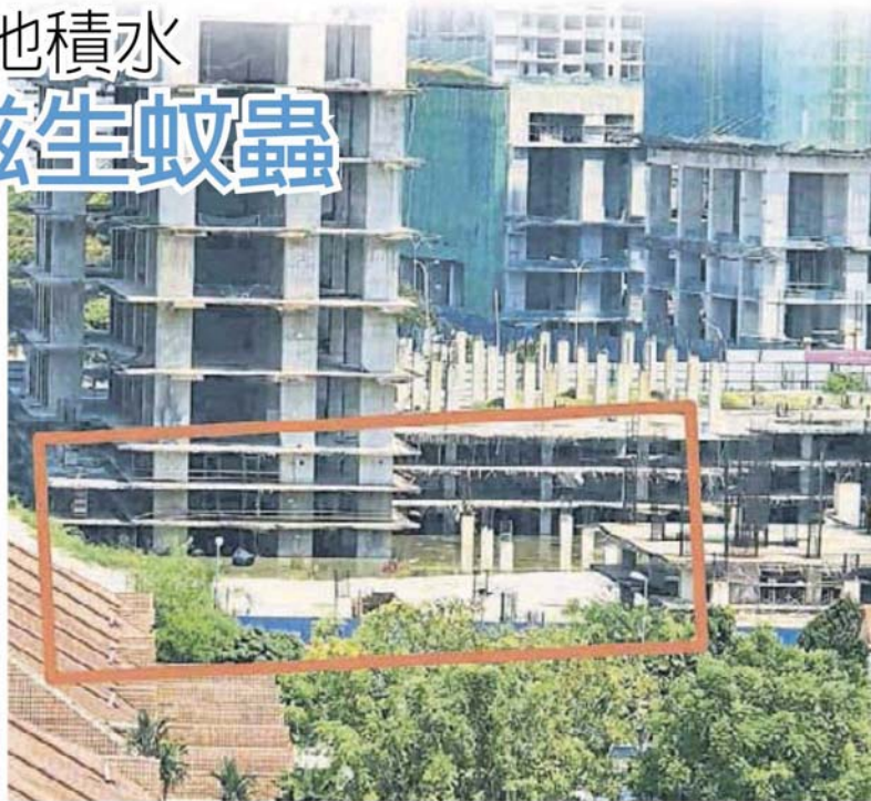
■ 工地积水让居民担忧滋生蚊虫。