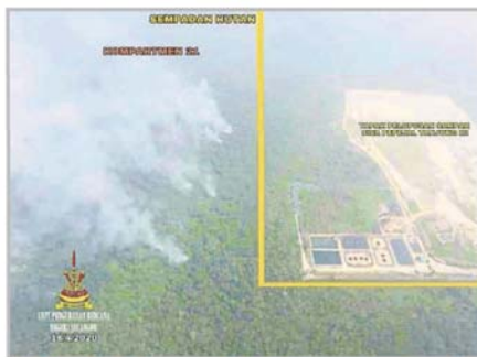
■环衔接大道和丹戎12的垃圾填埋场旁边发生林火的第21地段位于第二中环

他说，雪州天灾管理及援助委员会(UPEM)、消防队、警方、土地局、瓜冷市议会和森林局今早已进行会议，下午2时一行40人就会到林火现场。